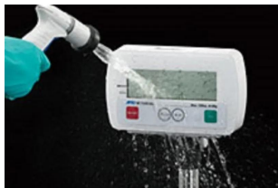
写真は、表示部の洗浄イメージです。