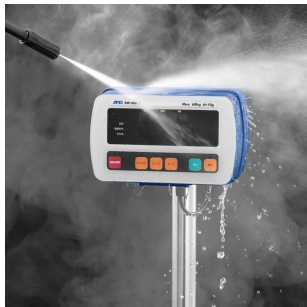
写真は、表示部の高水圧洗浄イメージです。