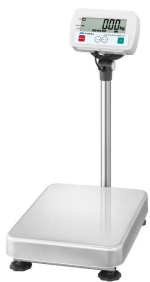
写真は、商品イメージです。