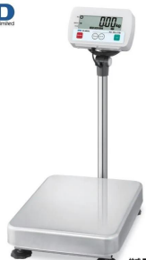
写真は、商品イメージです。