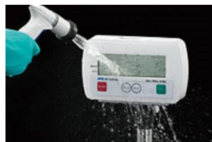
写真は、表示部の洗浄イメージです。

<font color="red">発送予定日は地区番号「4」の地域でご使用できる はかりの発送予定日となっております。 使用地区によって在庫状況が異なり、納品まで最大3ヶ月ほどかかる場合 がございます。 お急ぎの場合はお問い合わせください。</font><br><br>洗える I P 6 8、全体に水をかけて洗浄可能。細部まで洗浄しやすく、ゴミ・汚れが 溜まらないスケルトンフレーム構造 ・はかり一般校正書面付き(校正成績書・校正証明書・トレーサビリティ 書類) ・防塵/防水の表示部と計量部で、全体に水をかけて洗浄可能 ・スケルトンフレーム構造：ステンレス製 ・文字高39?oの大型LCD表示 ・3段階のコンパレータ表示 ・電源は、アルカリ乾電池6個(別売)で約5000時間連続駆動 ・ご注文時には、使用地区をご指定下さい