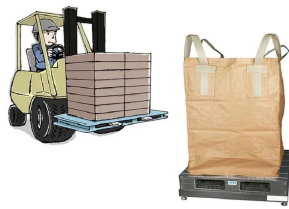
写真は、計量作業のイメージです。