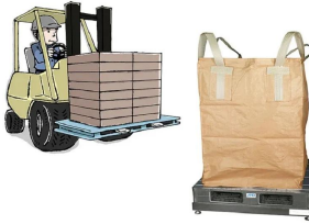
画像は、計量作業のイメージです。