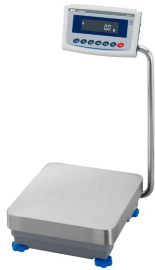
画像は、商品イメージです。