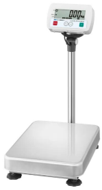
写真は、商品イメージです。