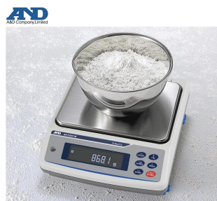
画像は、粉体計量のイメージです。