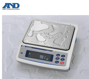
画像は、水濡れのイメージです。