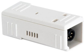
※エー・アンド・デイ