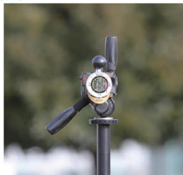
画像は、付属の三脚取付用電池フタを使用し、三脚に取り付けたイメージです。