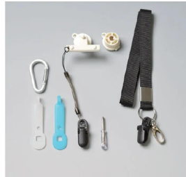
画像は、付属品(一部)のイメージです。