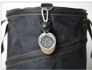
画像は、付属のカラビナで取り付けたイメージです。