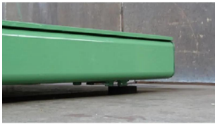
ロードフット部分