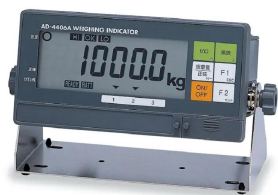
画像は、表示部のイメージです。