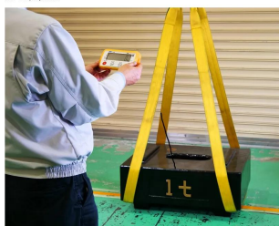
画像は、外部表示機での作業イメージです。