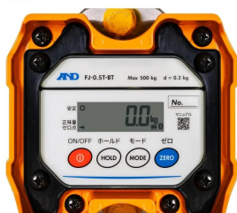
画像は、本体表示部のイメージです。 ： F J - 0 . 5 T - B T