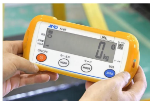
画像は、外部表示機の手持ちイメージです。