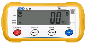
画像は、外部表示機のイメージです。