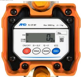
画像は、本体表示部のイメージです。