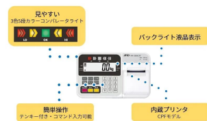
画像は、表示部のイメージです。内蔵プリンタ付は、別モデルです。