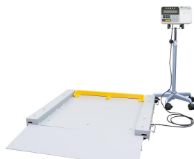
ストッパは黄色の部品は別売品です。 画像は、商品イメージです。ストッパは別売品です。