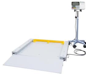
ストップパ(黄色の部品)は別売です。 株式会社エー・アンド・デイ 画像は、商品イメージです。ストップパは別売品です。