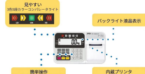
画像は、表示部のイメージです。