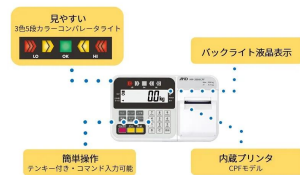
株式会社エー・アンド・デイ 画像は、表示部のイメージです。