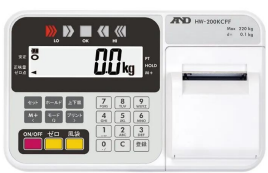
株式会社エー・アンド・デイ 画像は、表示部のイメージです。