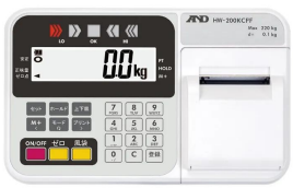
株式会社 エー・アンド・デイ 画像は、表示部のイメージです。