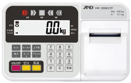
株式会社エー・アンド・デイ 画像は、表示部のイメージです。