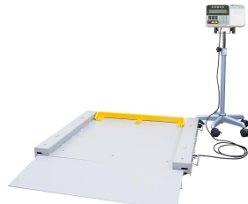
ストップパ（黄色の部品）は別売です。 株式会社エー・アンド・デイ 画像は、商品イメージです。ストップパは別売品です。