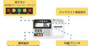
株式会社 エー・アンド・デイ 画像は、表示部のイメージです。