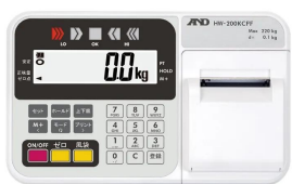
画像は、表示部のイメージです。