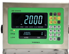
画像は、表示部のイメージです。