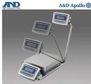
画像は、スイングアームのイメージです。