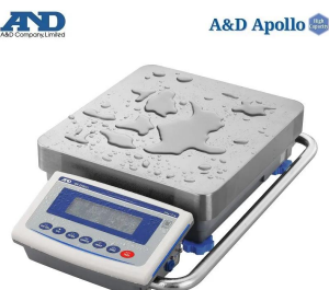
画像は、水濡れ環境のイメージです。