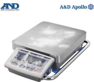
画像は、粉塵環境のイメージです。