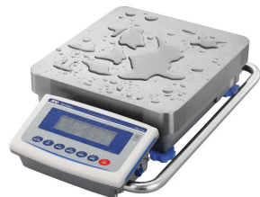
画像は、水濡れ環境のイメージです。