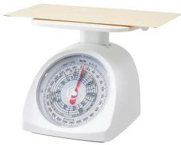
画像は、郵便物を載せたイメージです。