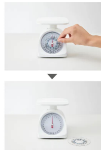
郵便料金改定があっても、郵便料金シートの付け替えが簡単に行えます