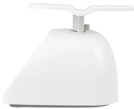
画像は、商品側面のイメージです。