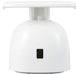
画像は、商品背面のイメージです。