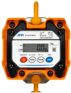
画像は、本体表示部のイメージです。