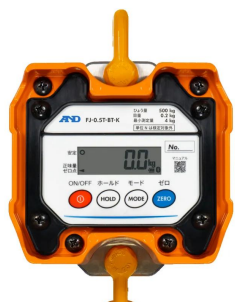
画像は、本体表示部のイメージです。