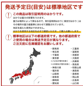
表示されている発送予定日は標準地区の計量器となります。他の地区でご使用の場合は表示と異なります。お問い合わせください。

発送予定日(目安)は標準地区です ① この商品は取引証明用のはかりです。 はかりは重みの影響をうけます。 重みは場所によって異なるので、取引証明用はかり(検定付はかり)はその場所の重力値基準にあわせて調整されています。 地区を越えた使用はできません。 はかりを使用する地区を必ずご確認いただき、ご購入をお願いします。 ② 標準地区は以下の都道府県です。他の都道府県で ご使用の場合は発送予定日が異なります。 ご注文前に在庫確認をお願いします。 ・群馬県 ・三重県 ・埼玉県 ・滋賀県 ・千葉県 ・京都府 ・東京都 ・大阪府 ・神奈川県 ・兵庫県 ・小笠原及び管内を除く・奈良県 ・和歌山県 ・静岡県 ・徳島県 ・山梨県 ・岡山県 ・岐阜県 ・広島県 ・静岡県 ・山口県 ・愛知県