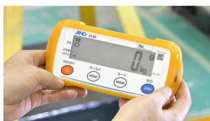
画像は、外部表示機の手持ちイメージです。