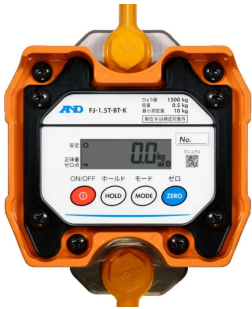
画像は、本体表示部のイメージです。 : FJ-0.5T-BT