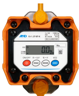
画像は、本体表示部のイメージです。 ：F J - 0.5 T - B T

取引・証明に利用できる検定付きはかり 手元で計量値を確認できるワイヤレス「外部表示器」付属 本体は、水に強いIP65 外部表示器は非防水 本体電源は、充電式電池または乾電池が使用可能 本体・外部表示器ともにバックライト付液晶表示 パワーオンゼロ / パワーオン風袋機能搭載 オートパワーオフ機能搭載 衝撃検出機能：ISD搭載 計量値の読み取りを容易にする「表示固定機能」搭載 表示値を記憶する「ロギング機能」搭載