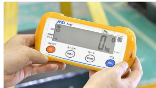
画像は、外部表示機の手持ちイメージです。