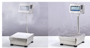
IP65規格適合の防塵・防水構造 ・IP65の防塵・防水性能を備え、水洗いも可能なステンレスボディ。 ・食品加工や化学薬品を取り扱う現場など、湿気や粉塵が多い場所でも安心してご使用いただけます。