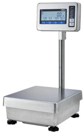
写真は、シリーズ代表画像です。