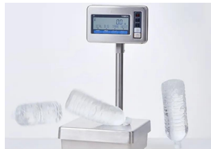
衝撃に強い頑丈設計 ・衝撃に対する筐体構造を見直し、 \pm 上20cmからの30kg衝撃落下試験をクリア。 ・思わぬ衝撃が加わっても、高い精度を保ち続ける強靭さを兼ね備えた一台です。