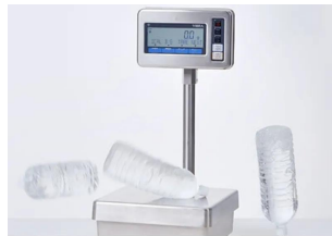
衝撃に強い頑丈設計 ・衝撃に対する筐体構造を見直し、±上20cmからの30kg衝撃落下試験をクリア。 ・思わぬ衝撃が加わっても、高い精度を保ち続ける強靱さを兼ね備えた一台です。