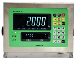
画像は、表示部のイメージです。