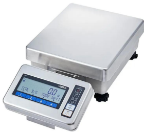
表示部一体用具（オプション）で取り付けられた場合 写真は、表示部一体用具（オプション）で取り付けられた場合の画像です。