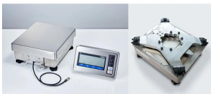
清掃性と組込み性を重視した筐体設計 ・筐体の凹凸を極力排除し、IP65規格のステンレス製筐体を採用することで、高い清掃性を実現しました。 ・表示部と計量部をコネクタ接続とすることで、ケーブル配線や設置組み込みの自由度を従来機から大幅に向上させました。

衝撃が加わっても高い精度を保ち続ける頑丈設計 外部からの振動影響を従来比1/10に低減 水洗い可能なIP65規格適合の防塵・防水構造 自動風袋引き機能で快適な計量作業 清掃性と組込み性を重視した筐体設計 内蔵分銅搭載でどこでも正確な高分解能計量が可能 取引・証明に使える検定付き