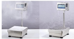
IP65規格適合の防塵・防水構造 ・IP65の防塵・防水性能を備え、水洗いも可能なステンレスボディ。 ・食品加工や化学薬品を取り扱う現場など、湿気や粉塵が多い場所でも安心してご使用いただけます。