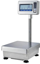
写真は、シリーズ代表画像です。