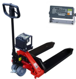
画像は商品イメージです。