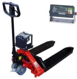
画像は商品イメージです。