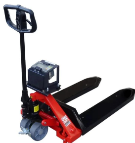
画像は本体イメージです。