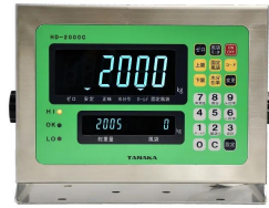
画像は、表示部のイメージです。