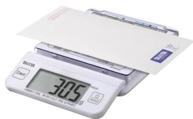
画像は、郵便物を載せたイメージです。