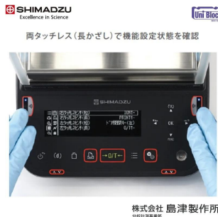
画像は、タッチレスセンサの使用イメージです。

SHIMADZUの「分析天びん AP W e xシリーズ」は、クラストップレベルの最小計量値を実現しました。重量検出機構と制御処理の改良により、計量の安定性と繰り返し性を向上しました。薬局方が求める最小計量値を1.3mg