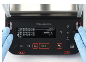
株式会社 島津製作所 画像は、タッチレスセンサの使用イメージです。