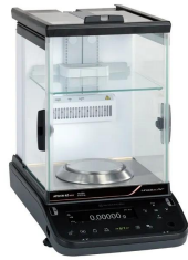
株式会社 島津製作所 画像は、ロゴマークなどの付いた商品 イメージです。