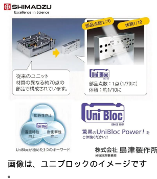
株式会社 島津製作所 分社/高専事業部 画像は、ユニブロックのイメージです。