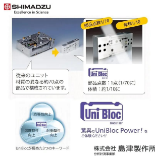
株式会社 島津製作所