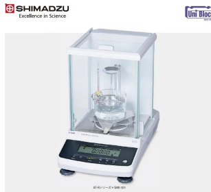
株式会社 島津製作所 分析計事業部