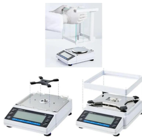
取り外しが簡単な風防部で、清潔を効率化