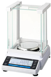
シリーズ代表画像