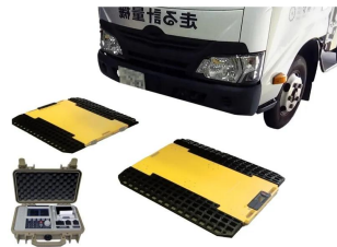
画像は、ロゴマーク等のついた商品イメージです。トラックは、商品に含まれません。