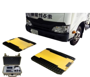
画像は、商品イメージです。トラックは、商品に含まれません。