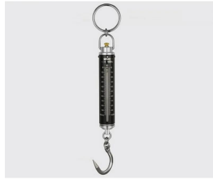
株式会社 三光精衡所 写真は、シリーズ代表画像です。