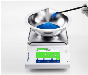
メトラー・トレド株式会社 画像は、計量作業のイメージです。 : ML-3002T