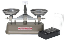
シリーズ代表画像です。