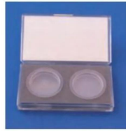
※2個収納用ブラケースの例