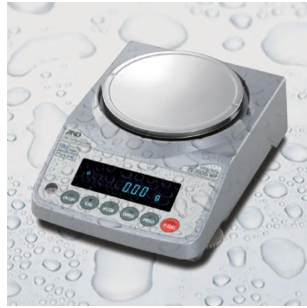
写真は、水滴が付く環境イメージです。