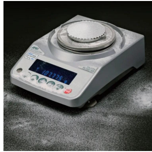
写真は、粉塵の舞う環境イメージです。