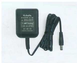
株式会社クボタ計装 株式会社クボタ (国産製計装事業ユニット) 画像は、商品イメージです。