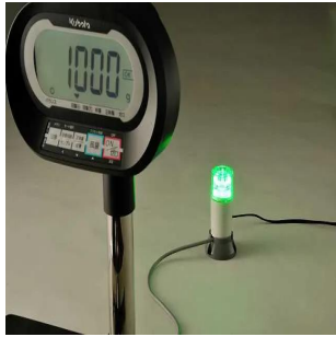
写真中のはかりは含まれません。