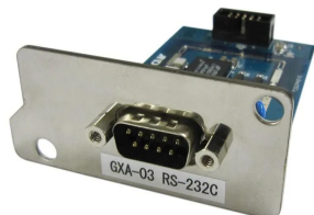
※エー・アンド・デイ