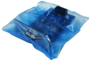
※エー・アンド・デイ