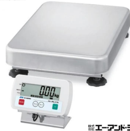
写真は、商品イメージです。